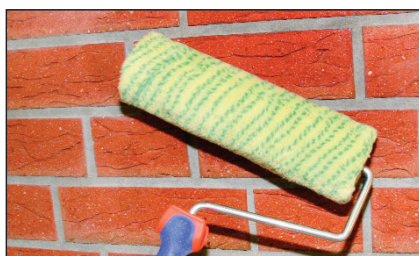
Naniesienie produktu BOTAMENT ® MS 80 W za pomocą wałka albo pędzla murarskiego