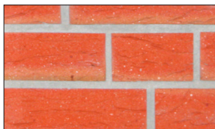
Dokładne oczyszczenie podłoża

BOTAMENT ® MS 80 W nadaje się do impregnacji wszystkich chłonnych powierzchni takich jak: beton, beton lekki, beton komórkowy, cegła ceramiczna, kamień elewacyjny, tynki kategorii CS I, CS II lub CS III wg PN-EN 998-1, kamień naturalny, dachówka o drobnych porach, cegła silikatowa, a także nieszkliwiony klinkier. Podczas aplikacji należy użyć tyle materiału, aby równomiernie pokrył całą powierzchnię. Aby zachować efekt impregnacji należy regularnie stosować BOTAMENT ® MS 80 W .